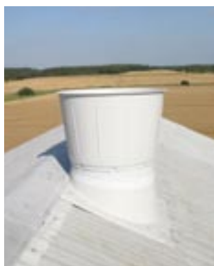
Kona med fast takintäckning