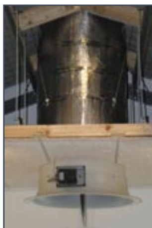
Frånluftsenshet typ CD monterad i stall.