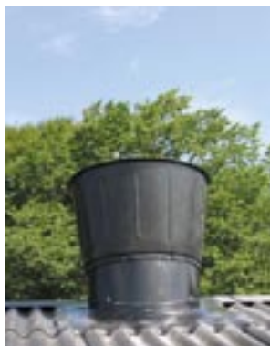
Kona med pvc- takintäckning