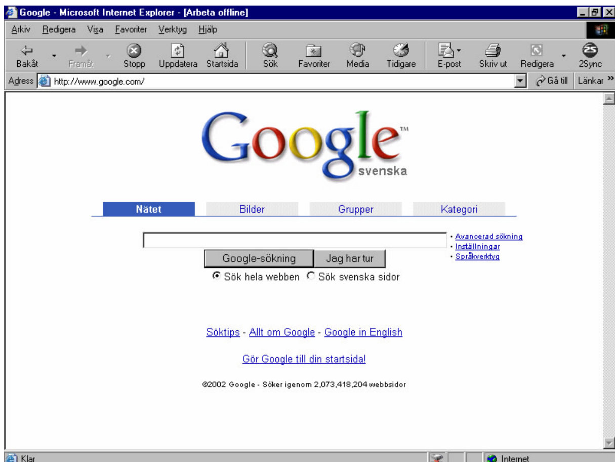
Huvudfönstret i Internet Explorer med sökmotorn Google uppe.

Internet Explorer består huvudsakligen utav ett fönster. Det är här du kommer att se sidorna och söka efter den information du vill ha.