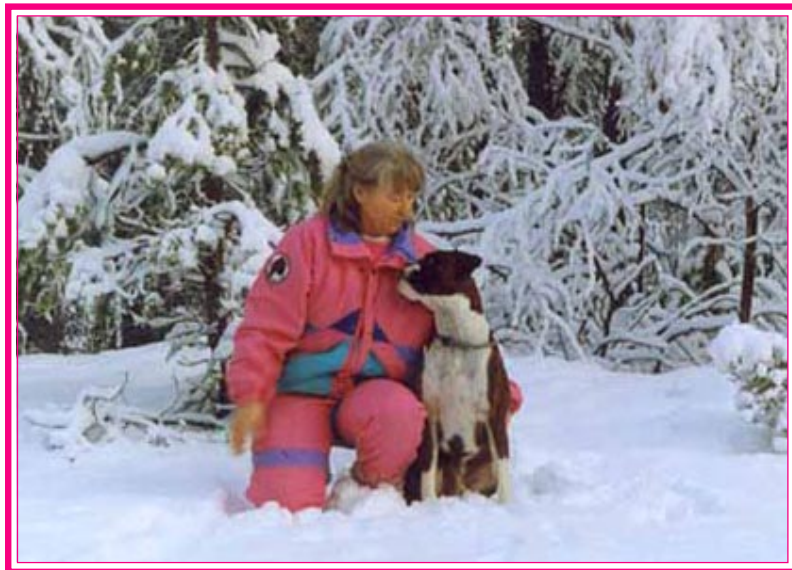
Var förtrolig med din hund.

Jag måste kommunicera med min nya hund! Ex.vis när man varit ute och jobbat med hunden kan man sätta sig bredvid den och titta den djupt in i ögonen och tala om hur duktig den varit som ”spårat”, ”letat apport”, ”hoppat”, eller vad den nu har gjort. Speciellt när den lärt sig något nytt. Det finns signalkänsliga (blyga) hundar som inte vågar titta en i ögonen och då får man naturligtvis inte göra det, men man kan ändå vara förtrolig med sin hund och tala om hur duktig den är. Så småningom kanske den törs titta en i ögonen.