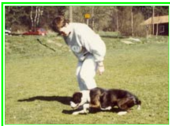
Belöna när hunden saxar bakbenen.

Om det finns en skryptunnel på klubben kan man så småningom låta hunden krypa igenom denna.